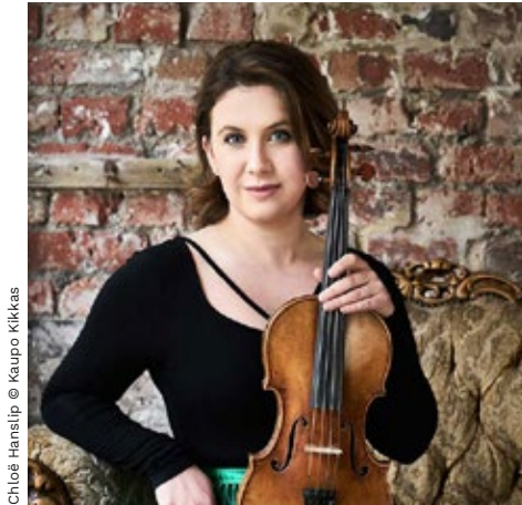
Chloë Hanslip